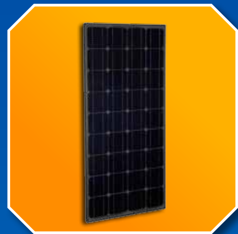
Zwarte panelen (Monokristallijne)

De systemen van HR Zonnepanelen gaan lang mee zonder noemenswaardig onderhoud.