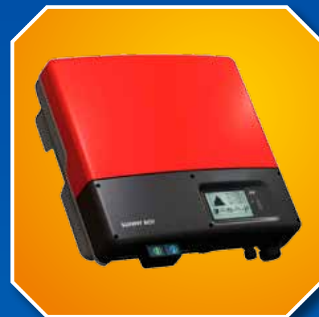
SMA omvormer Sunny Boy

Voor het aanvragen van een offerte of om een afspraak te maken met een van onze medewerkers, kunt u direct het bijgaande formulier invullen en afgeven bij uw Expert Wijchen!